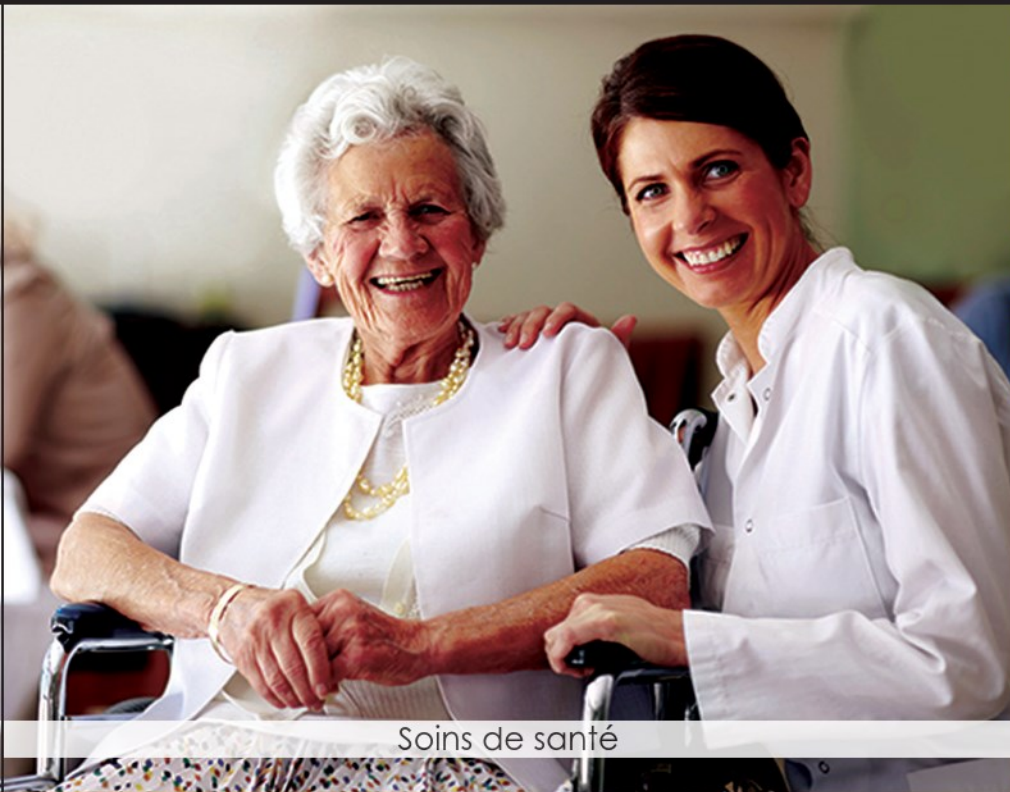
Soins de santé